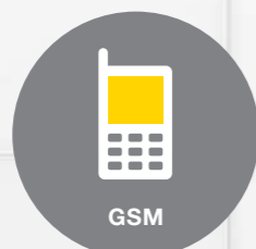
GSM Meldungen und Bedienung