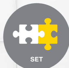
SET Einfache Erweiterung

Die Hausalarmanlage Jablotron passt sich genau an die Anforderungen Ihres Hauses an. Nichts von dem was bei Ihnen zu Hause vorgeht, entgeht dadurch Ihrer Aufmerksamkeit. Wenn Sie im Hause sind, überwacht die Alarmanlage Ihre Garage, wenn Sie schlafen, überwacht das System auch noch das Erdgeschoss und den Garten. Wenn Sie das Haus verlassen, werden auch alle sonstigen Räume überwacht.